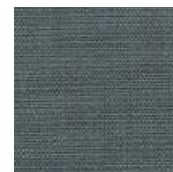
065-9209 CZ MÉDIO - C