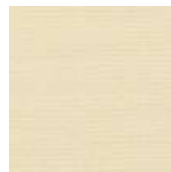
001-3161 MILK - C