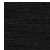
065-21 PRETO - E