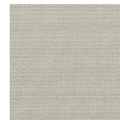
001-9215 CIMENTO - C