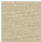
001-8207 GELO - C