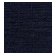
065-1427 ECLIPSE - E