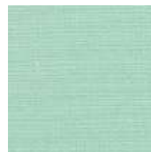
001-2262 MENTA - C