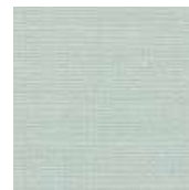
001-1433 AZ CLARO - C