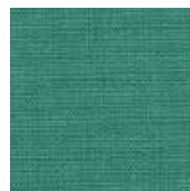
065-2261 JADE - M