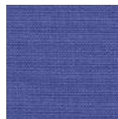
065-7304 RIVIERA - M