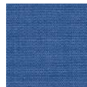
065-1426 ULTRAMARINE - M