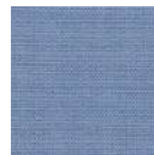
065-7305 LAVANDA - M