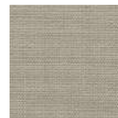
001-9213 ROCHA - C