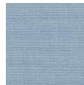
065-7303 MÓNACO - C