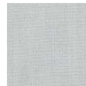
001-9212 VAPOR - C