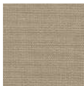
001-8208 KHAKEI - C