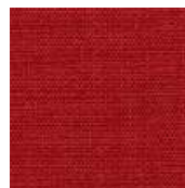
065-5179 CARDEAL - E