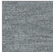
9198 MESCLA MÉDIO