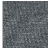
9219 MESCLA ESCURO