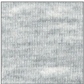
9157 MESCLA CLARO