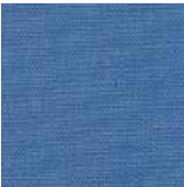
001-1435 PACÍFICO - C