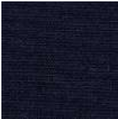
065-1432 INDIGO - E