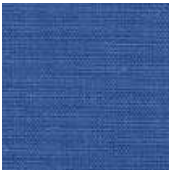
065-1426 ULTRAMARINE - M