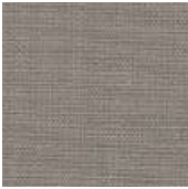
001-9213 ROCHA - C