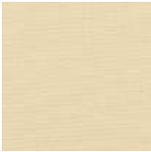
001-3161 MILK - C