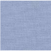
065-7303 MÔNACO - C