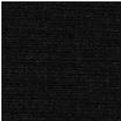
065-21 PRETO - E