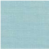
001-1433 AZ CLARO - C