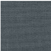
065-9209 CZ MÉDIO - C