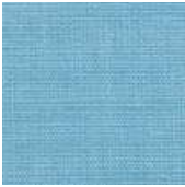
001-1434 PRISMA - C