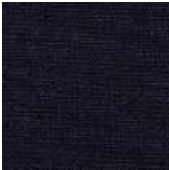
065-1427 ECLIPSE - E