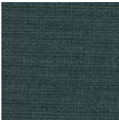
065-9211 CZ ESCURO - C