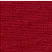
065-5179 CARDEAL - E