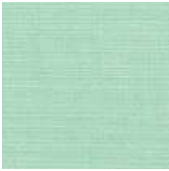
001-2262 MENTA - C