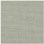
001-9215 CIMENTO - C