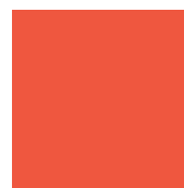
065-4123 POPPY - ESP