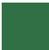
001-2123 GREEN PEPPER