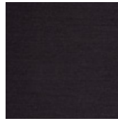
001-9236 CINZA MÉDIO