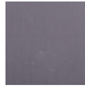
001-9235 CINZA CLARO