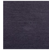
001-9237 CINZA ESCURO