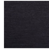
001-9219 MESCLA ESCURO